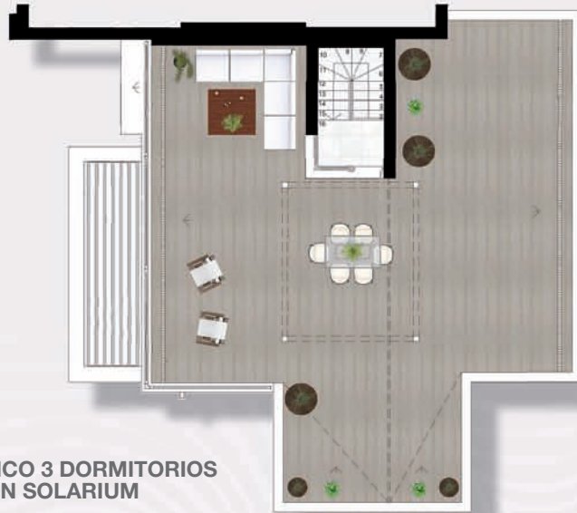
ÁTICO 3 DORMITORIOS CON SOLARIUM