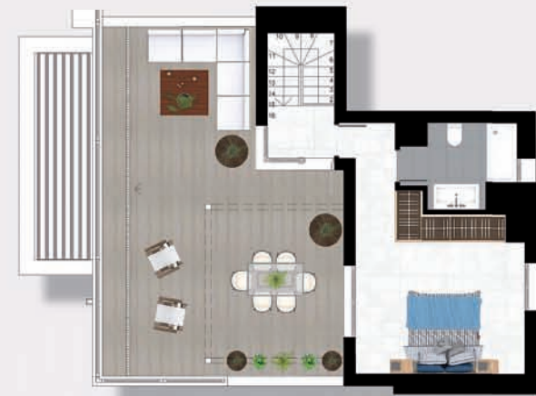
DUPLEX 3 DORMITORIOS CON SOLARIUM