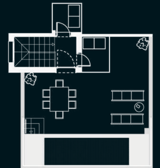
PLANTA SOLÁRIUM / PISCINA