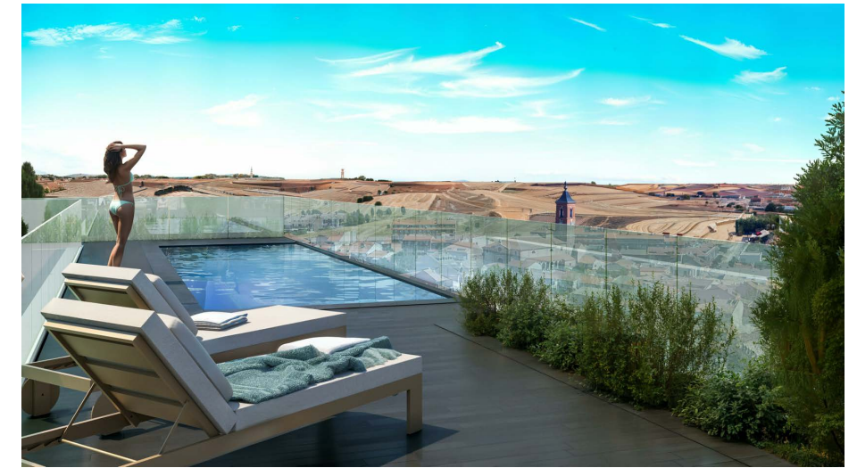
VIVIENDA 1D_4 12 Ud