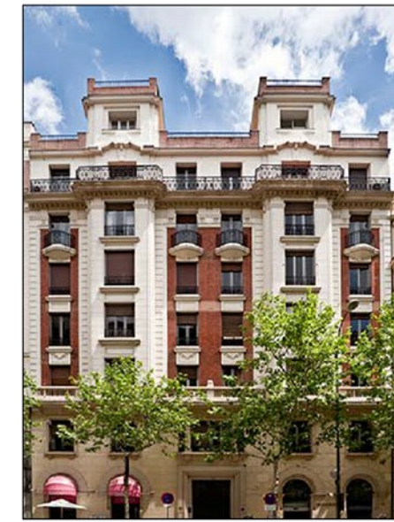
SITUACIÓN EN EL BLOQUE