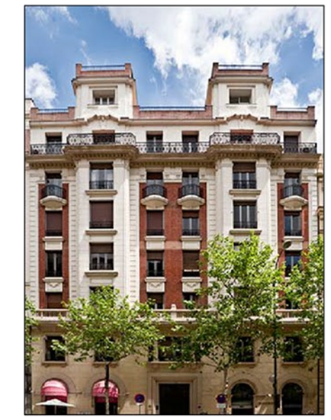
SITUACIÓN EN EL BLOQUE